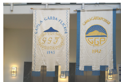
De tu har äntligen blivit ett.

Den 6 oktober 1942 bildades Föreningen Gamla Gårdapojkar och på dagen 75 år efter detta bildande firade den nu gemensamma föreningen sitt jubileum. Jubileumsfesten, som lockade drygt 70 personer i form av medlemmar och en hel del "respektive", ägde rum "mitt i smeten", alltså ganska precis i hörnet mellan gamla Gårdavägen och Fabriksgatan, det som idag heter Gårdatorget. Restaurang MVG upplät sina fina lokaler och lagade en alldeles utmärkt middag till oss.