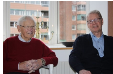
Ny och gammal Gårdapojk.

serverar lunch varje dag utom lördag. Varje person som bor i lägenhet här skall betala för ett visst antal måltider per år. Restaurangen är belägen i Tornhuset med sitt karakteristiska klocktorn, uppfört 1923, och som fortfarande är i bruk. Klockorna ljuder varje dag kl 9.00, 12.00 och 17.00 med korta melodier av Wilhelm Stenhammar.