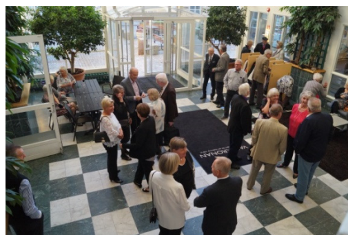
Mingel med bubbel.

Den 6 oktober 1942 bildades Föreningen Gamla Gårdapojkar och på dagen 75 år efter detta bildande firade den nu gemensamma föreningen sitt jubileum. Jubileumsfesten, som lockade drygt 70 personer i form av medlemmar och en hel del "respektive", ägde rum "mitt i smeten", alltså ganska precis i hörnet mellan gamla Gårdavägen och Fabriksgatan, det som idag heter Gårdatorget. Restaurang MVG upplät sina fina lokaler och lagade en alldeles utmärkt middag till oss.