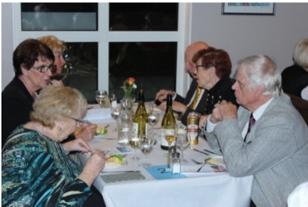
Gårdatjöt med mycket gott till bords. Artikel-författaren sitter nederst till höger.

Generositet och hemkänsla, det satt fint. Riktigt fint! /Eivon Johansson