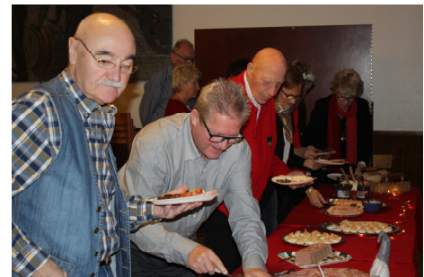
"Den som väntar på nåt gott, får köa lite grann..."

Det sista för året av möten var julfesten i början av december. "Förr i tiden" bjöds "pojarna" in till "flickornas" fest, med julklappsdelning och allt, men sedan vår sammanslagning hade vi festen gemensamt från början.