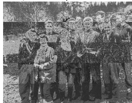
Kamratskap på Härsjönäs 1954.

Men i foton kan man få en uppfattning av det som inte finns ord för, kamratskapet.