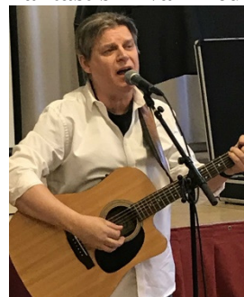
Bohusläning och, artist, minst sagt!