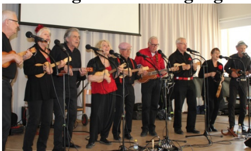
Ukulelebandet i full spruta.

Det för kvällen nio personer starka Ukulelebandet gästade oss vid vårens sista medlemsmöte. Bandet, som har lirat samman i mer än 20 år fick vi veta, har hunnit skaffa sig en vid och stor repertoar bl a med låtar från det sena femtio- och tidiga sextiotalets "snällrock", Cornelis visor, Lill-Babs tidiga (Leva livet, tex), Taube, ett medley med "Chuckens" och Little Richards tidiga rivlåtar. De gav oss cirka 50 minuters intensiv föreställning där musikanterna hade egna solopartier ibland, delade upp sig i diverse doakörer och växelsång ibland, och visade ofta ett fint ensemblespel och -sång. Numera finns både bas, dragspel och liten rytmsektion i bandet i olika låtar. Och alla spelar ukulele och sjunger förstås.