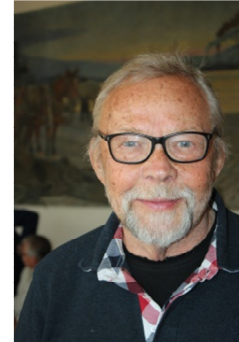
Lorra vid vårens sista medlemsmöte.