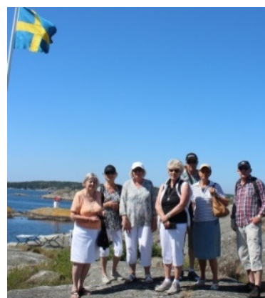
Några av de 26 dagsnjutarna

Den 8 juni, en ljuvlig försommar dag, träffades 26 Gamla Gårda flickor och -Pojkar, en del med "respektive", på Saltholmen för att bätas ut till Knarrholmen, en ö i Göteborgs södra skärgård. 1940 skänktes ön till Götaverkens arbetare som sommarrekreationsö av skeppsredaren Axel Ax:son Johnson. Sedan dess bytte den ägare till en avdelning inom Metall och en inom Handels och 2014 såldes ön till ett byggföretag. Man rev de flesta stugorna, butiken och restaurangen och byggde nya moderna större bostadsrättsstugor och -"studios", som betingar rätt häftiga priser. En del välhållna stugor ("Tältstaden") på ost- och läsidan finns kvar.