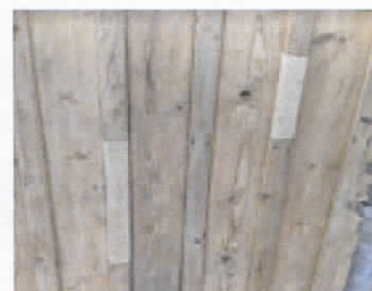
► Delar av locklister utbytta p.g.a röta.