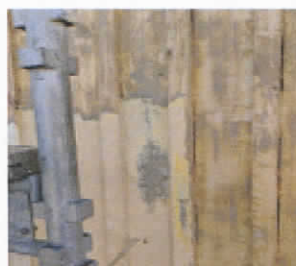
► Fasad där färg delvis skrapats bort.