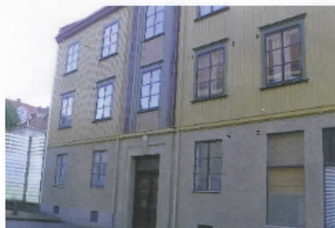
► Fasad mot Gudmundsgatan.