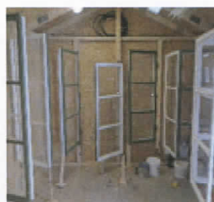
► Fönster på tork.