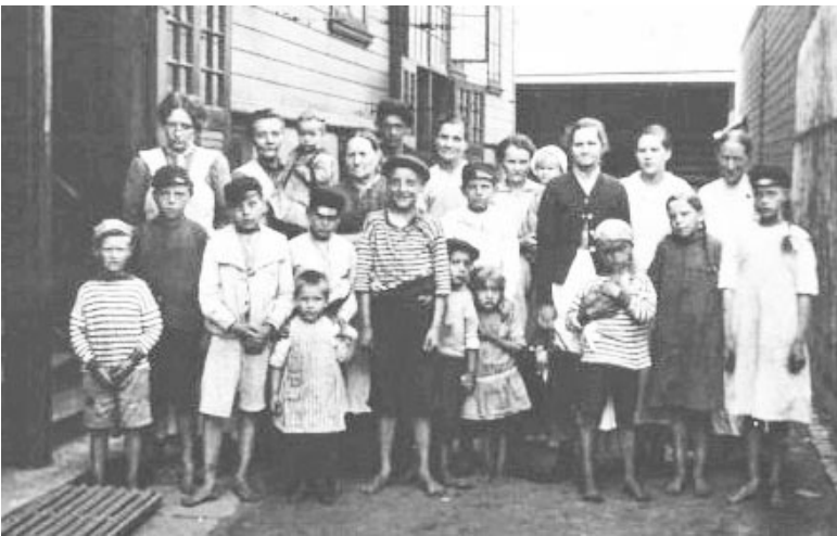
Barfota på gården

Levnadsvillkoren var hårda, låga löner, långa arbetsdagar, bristfälliga arbetsmiljöer, trånga och osunda bostäder. Samhällelig välfärd, sjukvård och omsorg som vi idag är vana vid fanns inte. Fattigdomens pris var högt, statistiken över barnadödlighet och medellivslängd talar sitt tydliga språk.