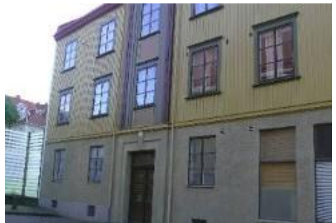
► Fasad mot Gudmundsgatan.