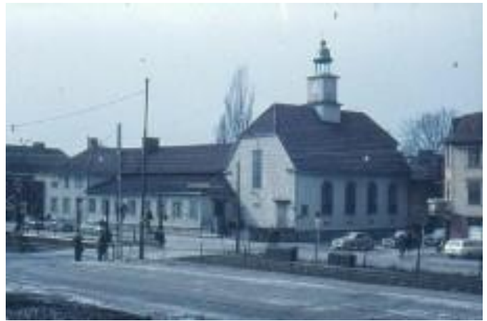
► Missionskyrkan på Gårda.

I Missionskyrkan på Dämmevägen gick jag med i scouterna (SMU). Det var kul, lite som en fritidsgård. Vi hade uniform och fick lära oss bl.a. att slå knopar. Förmodligen gjorde vi och lärde oss en massa annat också.