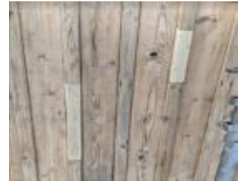
► Delar av locklister utbytta p.g.a. röta.