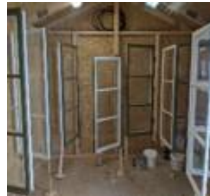
► Fönster på tork.