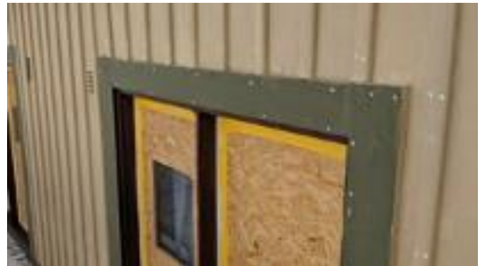
► Gudmundsgatan 13 efter första strykning med linoljefärg. De vita prickarna är spikhattar som fått den andra strykningen av rostskydd.