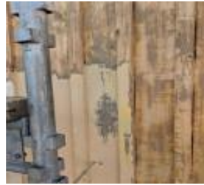
► Fasad där färg delvis skrapats bort.