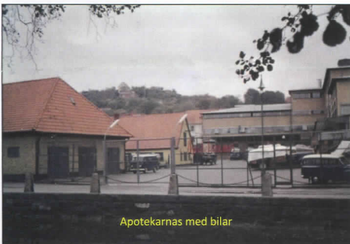
Apotekarnas med bilar