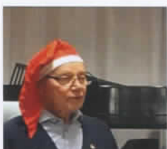
Dennitz klär i passande luva

Då har det åter gått ett år. Det lackar mot jul och nyår. Vi var 37 medlemmar som samlades till årets sista medlemsmöte. Vid detta möte mottogs medlemmarna av styrelse iförda moderiktiga röda tomteluvor. Väldigt stämningsfullt.